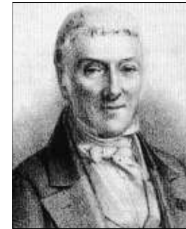
Von 1809 bis 1814 wirkte Ladoucette als Präfekt in Aachen.

Umweltschutz kontra Industrie: Auch damals ein Thema. Der reisende Edelmann berichtet von Bleimineralien bei Kommern, die eine gravierende Verschmutzung des passenderweise Bleifluss getauften Gewässers zur Folge haben, das bei Gymnich in die Erft mündet. Felder würden bei Überschwemmungen unfruchtbar, das Vieh erleide Koliken, wenn es das Wasser trinke. Aber, so der Entdeckungsreisende: „Der Verstand verweigert sich der Idee, solch kostbare Reichtümer ungenutzt zu lassen“. Er schlägt vor, dass die Minenkon-